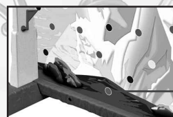
Punto de partida del primer escalador

En caso de que la flecha de la ruleta se quede justo en el medio de dos casillas se volverá a tirar.